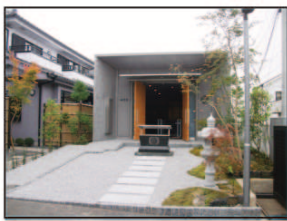
●最近のお仕事 2013年6月 瑞穂町

家を購入する際は、十分な自己資金を積み立てる一方で、無理なく返済できる住宅ローンを組む必要があります。税制に左右されず、失敗しない家造りのため尽力いたします。